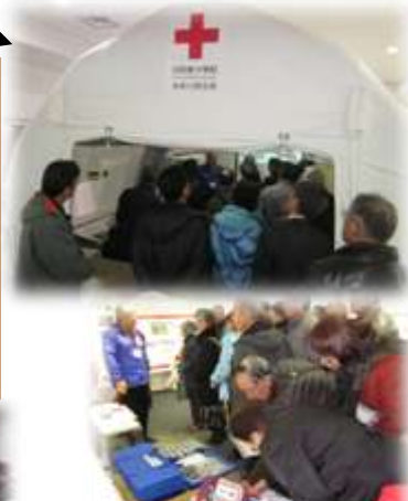
日赤から支給される、被災者救援物資 安眠セットや簡単な日用品。

このテントは金属を使用せず骨組み部分は空気で膨らませます。簡単で安全、軽量、短時間で設置でき、組み立て後は 4 倍の大きさで、かなりの収容力です。