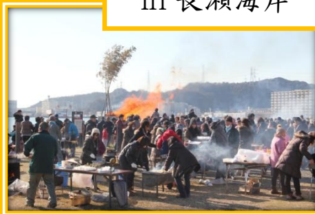
長瀬町内会 in 長瀬海岸

2015年1月11日(日)晴 久里浜地区のどんど焼きに朝早くから多くの人が集まりました。このどんど焼きは、小正月(こしょうがつ)の行事で、お正月に飾ったしめ縄や門松、だるまなどを燃やします。 このような地域の伝統行事が、子どもたちが地域を知るきっかけになると良いですね。