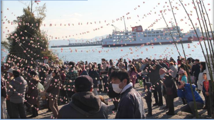
久里浜町内会 in 久里浜海岸