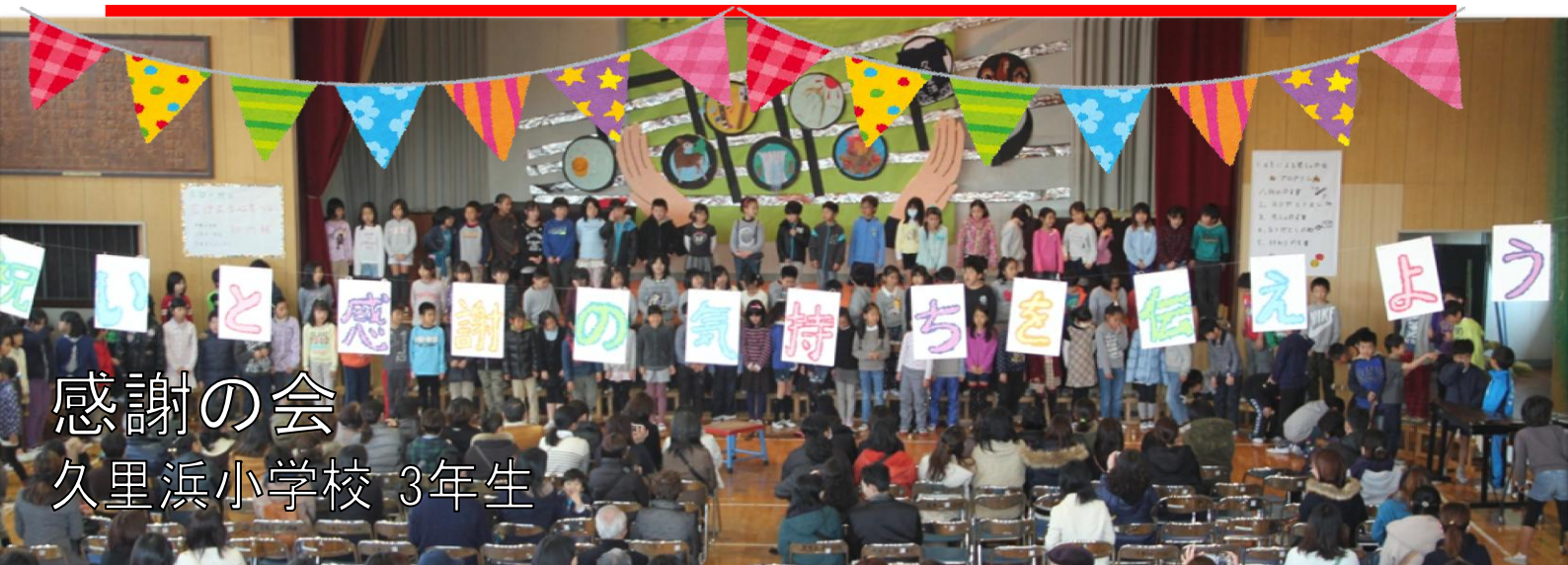
感謝の会 久里浜小学校 3年生