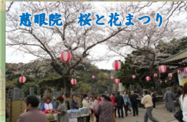
慈眼院 桜と花まつり