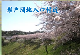
岩戸団地入口付近