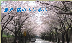
岩戸 桜のトンネル