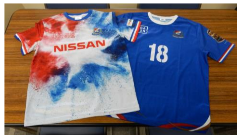
試合日や試合の前日に、応援の意を込めて行政センターの職員もユニフォームを着用しています！