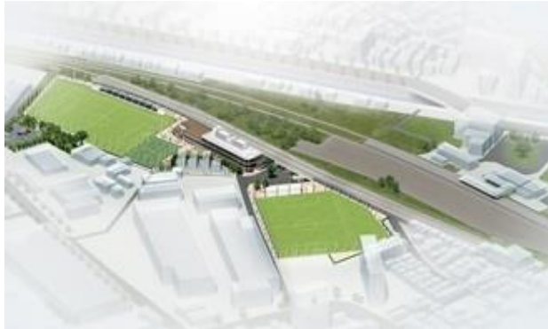
★ 完成予想図 ★